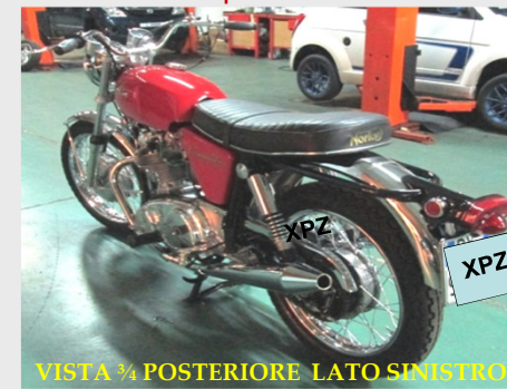
VISTA ¾ POSTERIORE LATO SINISTRO