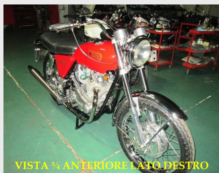
VISTA ¾ ANTERIORE LATO DESTRO

Oltre alla documentazione sopraindicata, per ottenere i certificati A.S.I. occorrono le seguenti foto realizzabili da noi presso il Club con € 35,00 di rimborso spese: