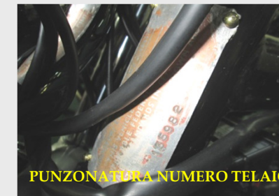
PUNZONATURA NUMERO TELAI